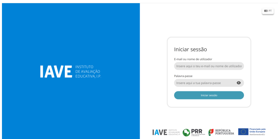
Figura 1 – Acesso à Plataforma de Realização das Provas Eletrónicas do IAVE

(Obs.: Para as escolas que optaram pelo offline em rede ou standalone, os procedimentos para acederem à Plataforma de Realização das Provas Eletrónicas do IAVE irão ser oportunamente divulgados)