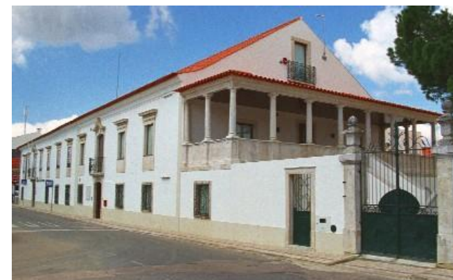
MUSEU DA PEDRA – CANTANHEDE