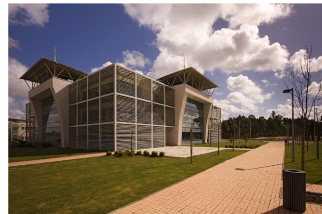
BIOCANT DE CANTANHEDE